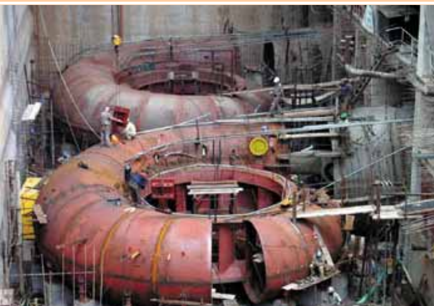
Montagem da caixa espiral das turbinas 1 e 2