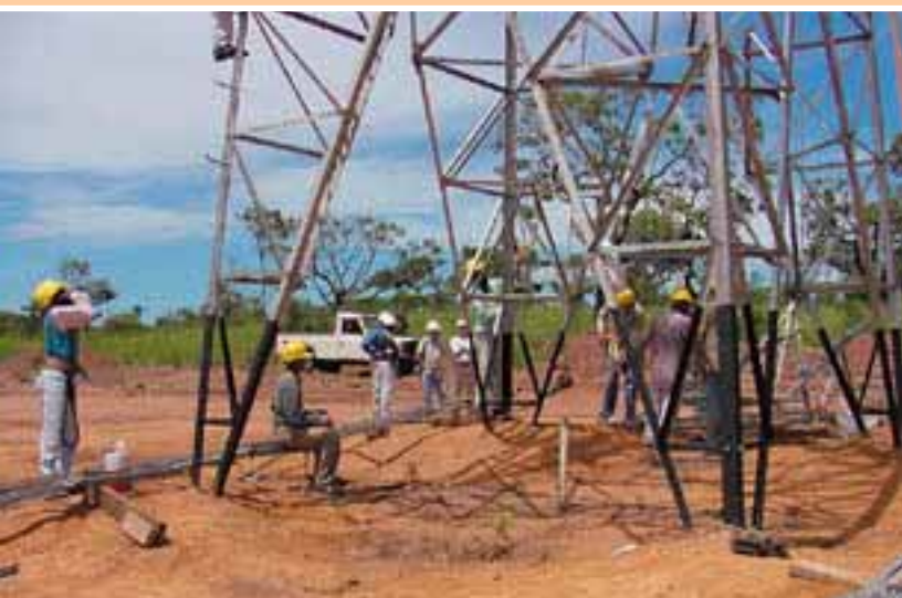
A linha de transmissão Capanda-Cambambe escoará a energia produzida pela Hidrelétrica de Capanda